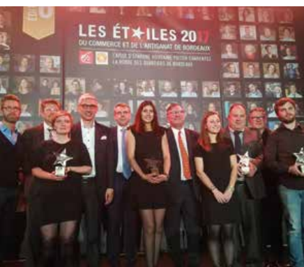
Découvrez les gagnants des Étoiles du Commerce et de l'Artisanat en p.9