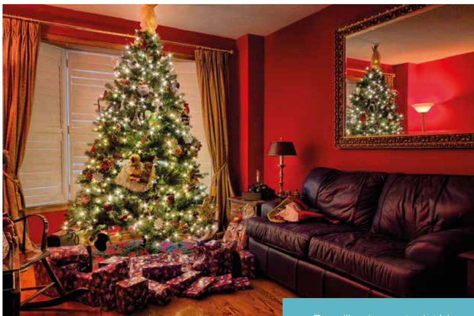
Pour illuminer votre intérieur pour les fêtes, rendez-vous en p.11

contact.laronde@orange.fr www.larondedesquartiersdebordeaux.com 102, rue Sainte-Catherine - 33000 Bordeaux Tél : 05 56 81 12 97