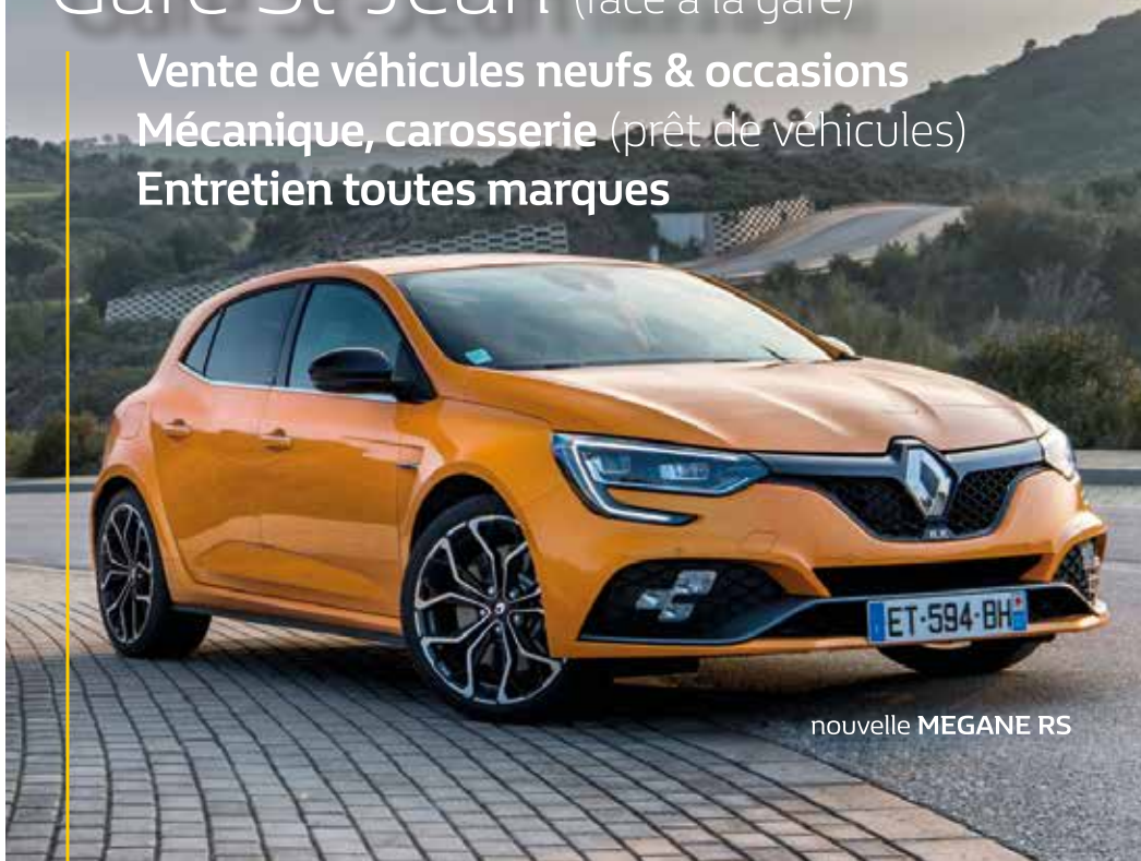
nouvelle MEGANE RS